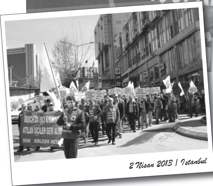
2 Nisan 2013 | İstanbul

MESS ve Bosch yönetimi kirli ortaklığında Bosch'ta öncü işçilerin işten atılması Birleşik Metal-İş'in Bursa ve İstanbul'da gerçekleştirdiği basın açıklamasıyla protesto edildi. İşten atılan Bosch işçileri, İstanbul'da yaptıkları eylem sonrası Bosch'un Maslak'ta bulunan merkez ofisinin karşısına çadır kurarak direnişe başladı.