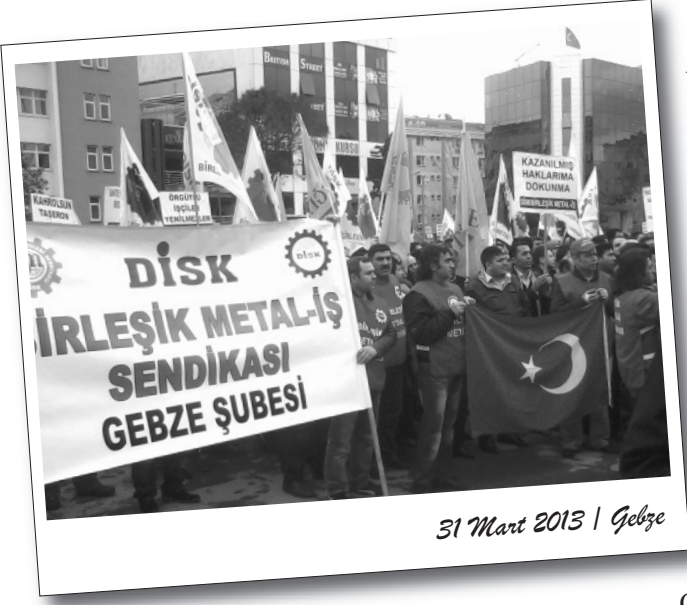
31 Mart 2013 | Gebze

2012-2014 MESS Grup TİS sürecinde uyuşmazlık zaptının ardından Birleşik Metal-İş tepkilerini eylem ve basın açıklamalarıyla göstermeye devam ediyor.