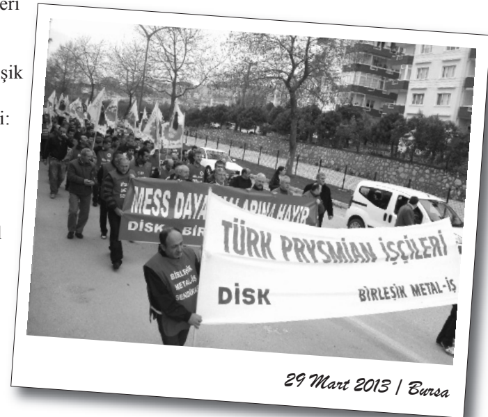
29 Mart 2013 | Bursa